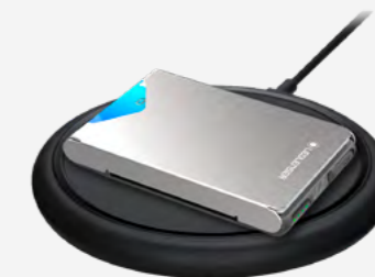
Kabelloses Laden (Qi) (Ladestation nicht im Lieferumfang enthalten)