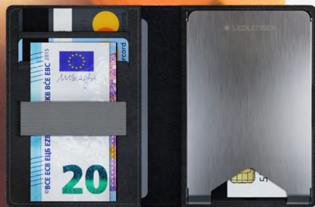
Abb. LITE WALLET

Das Ledlenser Lite Wallet ist der praktische Alltagsbegleiter für die Hosentasche. Der Kartenhalter ordnet Personalausweis, Führerschein, Kreditkarten oder auch Geldscheine. Dank des integrierten RFID-Schutzes sind sensible Daten dabei jederzeit sicher.