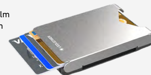
Abb. LITE SLEEVE