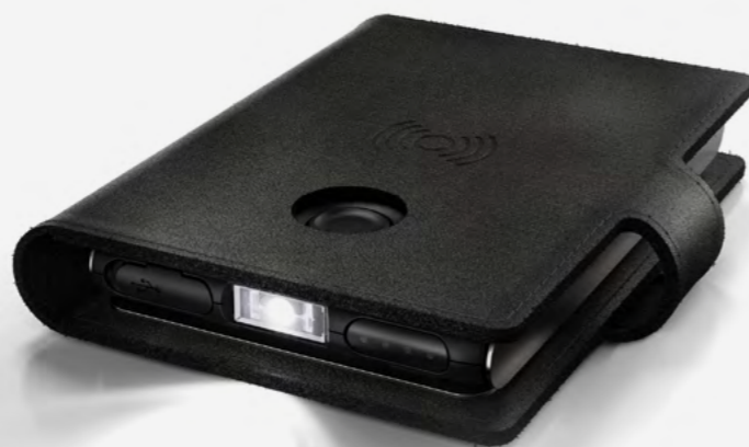
Abb. LITE WALLET